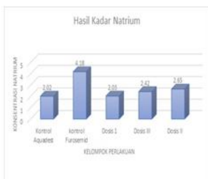
Gambar 3 Diagram Pengukuran Natrium (Na + ) Pada urin Mecit

Akuades 0,5 ml, furosemid 0,104 mg/20g BB Mencit, Dosis I 3 mg/20g BB; Dosis II 6 mg/20g BB; Dosis III 12 mg/20g BB.