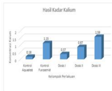
Gambar 4 Diagram Pengukuran Kalium (K + ) Pada Urin Mencit

Akuades 0,5 ml, furosemid 0,104 mg/20g BB Mencit, Dosis I 3 mg/20g BB; Dosis II 6 mg/20g BB; Dosis III 12 mg/20g BB.